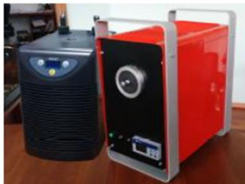
АЧТ 1 разряда, диапазон от -40\text{ }^{\circ}\text{C} до +2500\text{ }^{\circ}\text{C}

Предназначено для воспроизведения радиационной температуры.