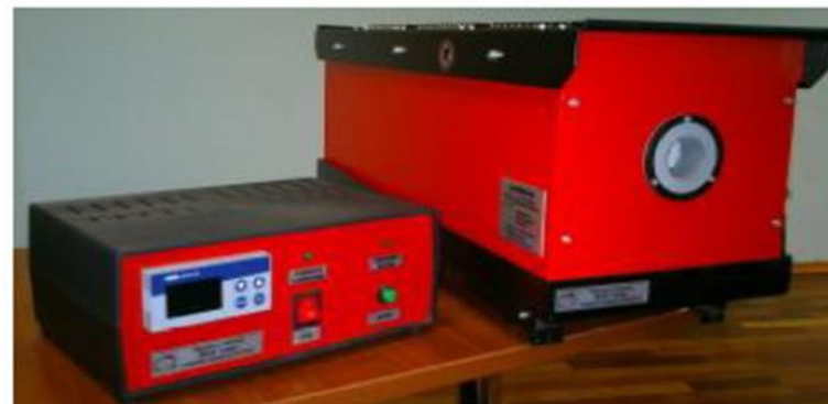
АЧТ 2 разряда, диапазон от -50\text{ }^{\circ}\text{C} до 160\text{ }^{\circ}\text{C}